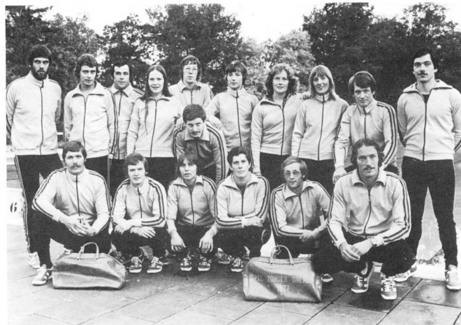
SELECTIETEAM DOETINCHEM SPEL ZONDER GRENZEN

Onafhankelijk weekblad voor het platteland.