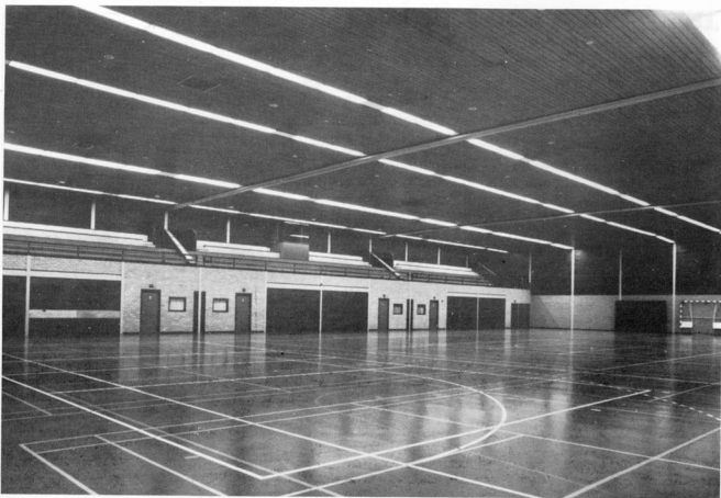
Sporthal - Sporting hall - Sporthalle - Halle des sports - Palazzetti dello sport