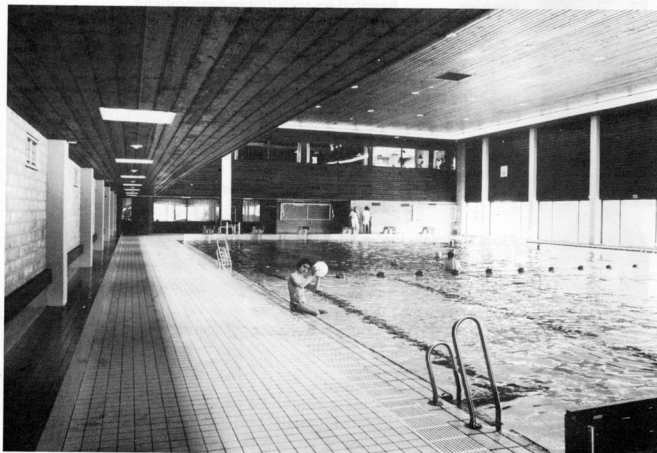
Overdekt zwembad - Roofed-in swimming pool - Hallenbad - Piscine couverte - Piscina coperta