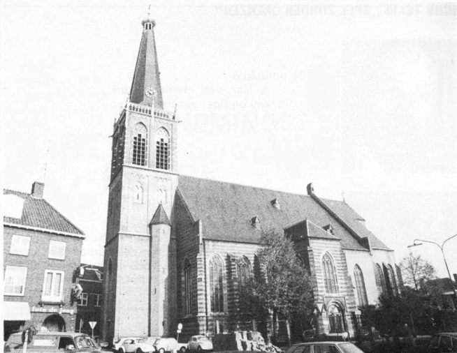
Grote Kerk - The church on the market-place - Die Kirche im Zentrum - L'Eglise au Marché - La chiesa nell'Centro