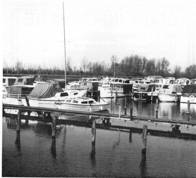
Jachthaven - Yachthaven - Jachthafen - Port de plaisance - Marina da diporto