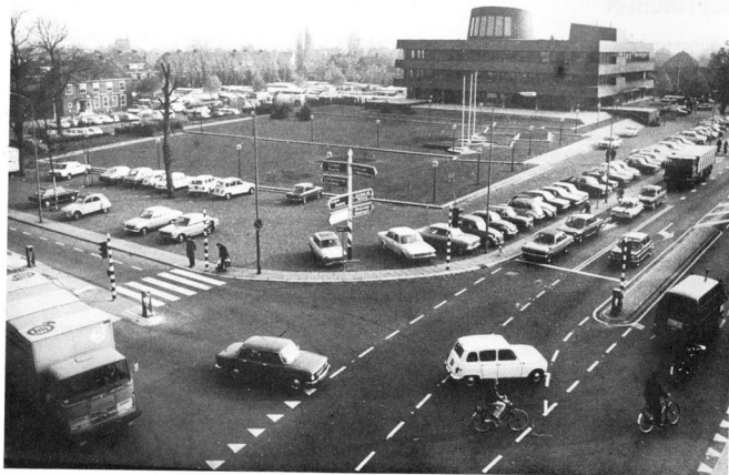
Stadhuis - Town-hall - Rathaus - L'hôtel de ville - Palazzo comunale

In questo senso, il sorgere di nuove autostrade di connessione tra le due nazioni, stimolato fin dal 1960 dallo stato, ha reso Doetinchem particolarmente adatta ad investimenti e al fiorire di nuove industrie. Già da qualche anno, il governo olandese mette a disposizione la somma di 5000 fiorini per ogni posto di lavoro, creato presso le aziende. Le bellezze naturali dei dintorni di Doetinchem e le possibilità ricreative offerte dalla città, rappresentano un grosso richiamo d'attrazione per la gente, oppressa dal super-affollamento della città dell'Ovest e della regione del Ruhr. Qui non mancano le opportunità di distrazione e di divertimento; tra l'altro c'è un teatro, „L'Amphion“, ci sono due cinema, la moderna biblioteca, due palazzetti dello sport due piscine coperte, diverse palestre di ginnastica e campi sportivi, ristoranti, bar e caffè.